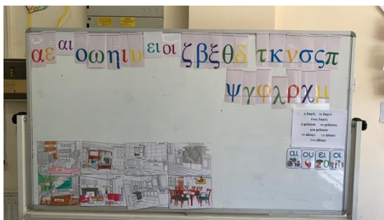
Φωτογραφίες: Παιδιά της μεταναστευτικής Επίπεδο Α2 στην εκμάθηση Ελληνικής ως δεύτερης γλώσσας.